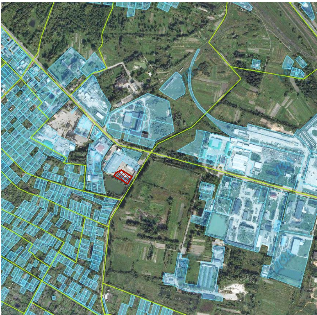
Ситуаційна схема М 1:10000